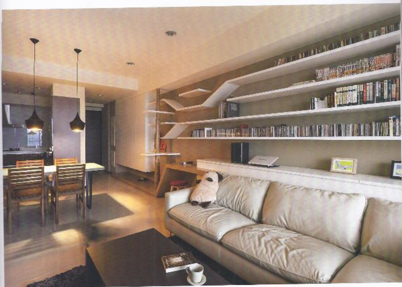
01 以黑色吊燈將視線聚焦，形構出場域別具心裁的結構。 02 溫暖的中性色調，讓整個空間顯得溫暖簡約。

在人與貓和平共處的世界裡，人們讓貓咪自然融入原有的生活場域之中，習慣所有家具擺設後所勾勒出來的動線，形構成貓咪的嬉遊空間。