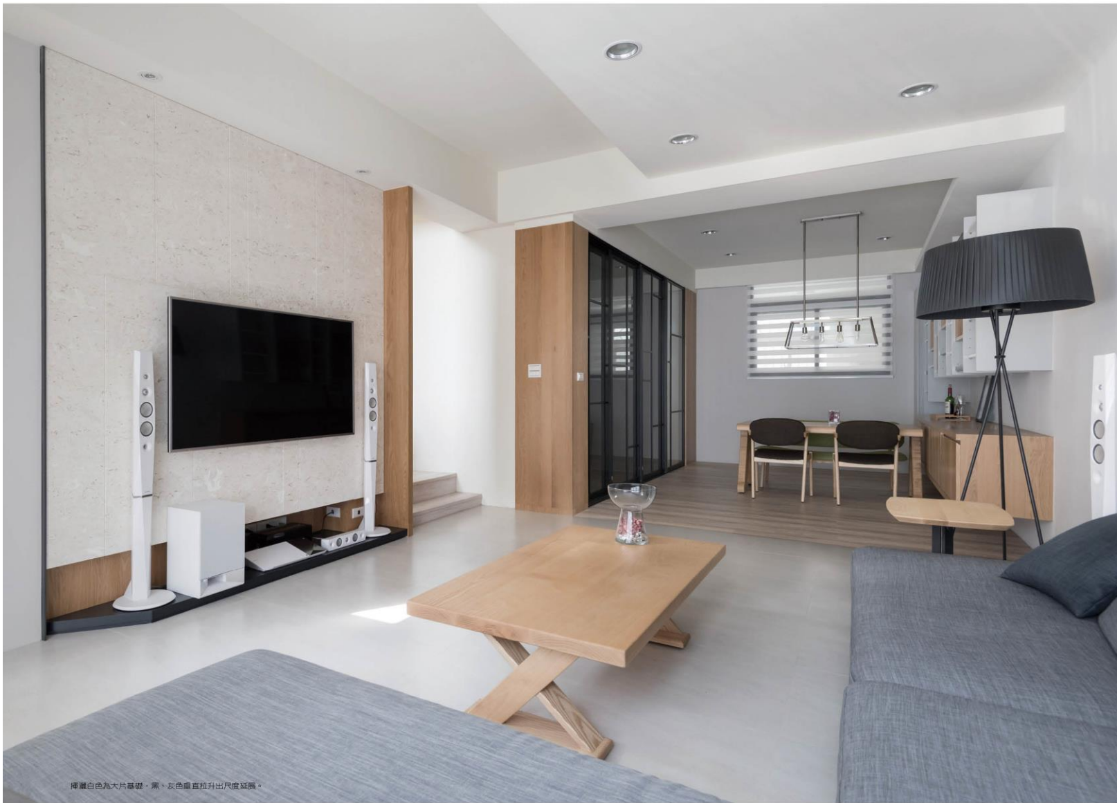
揮灑白色為大片基礎，黑、灰色垂直拉升出尺度延緩。