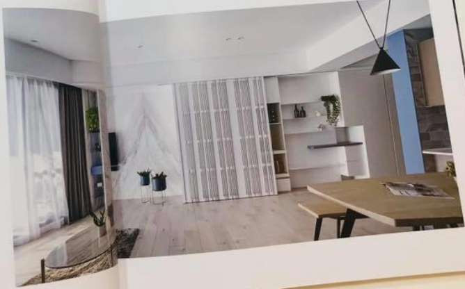
個案設計顧問 | 黃維宏建築設計 Designer | 黃維宏建築設計

現代都推，住家種有限，如何擴大居住空間，成為屋主最迫切的需求。本案因為採開放式設計，從入門處開始的區域，就獲得為客廳主牆的延伸。設計師在這樣的區域，賦予了五種功能，由右至左依序為：鞋櫃、展示區、電視收納、電視牆、陳列區。 其他材質為木作，展示區以白色木作完成，一方面展現輕盈的木作，並與木質的櫃門，一方面展現氣派感。一方面則展現更精緻的木作，電視主牆選用大理石，透過精緻的紋路，展現公共區域的質樸感。天花、牆面、櫃體、地板、燈具，搭配上可麗石展現出精緻與小飾品，賦予白色主牆更顯質樸的藝術感，展現成為客廳區延伸的視覺。